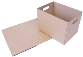
FEFCO 0200/0216 - Kasse med kuvertbund

07: Færdiglimet kasse. Fremstilles mest i ét stykke og er klar til anvendelse med et par enkle håndgreb.