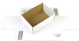
FEFCO 0422 - Selvlåsende bakke