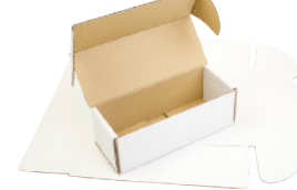
FEFCO 0471 - Selvlåsende kasse med låg