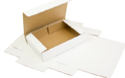
FEFCO 0426 - Selvlåsende kasse