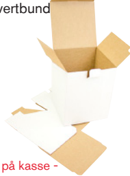
FEFCO 0215 - Kasse med kuvertbund