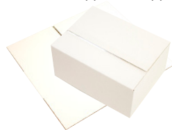
FEFCO 0202 - Foldekasse med overlappende flapper

For mere information kontakt os på telefon 45 - 700 702