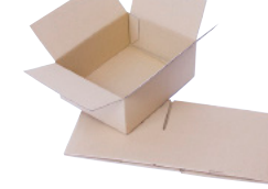
FEFCO 0701 - Kasse med automatbund