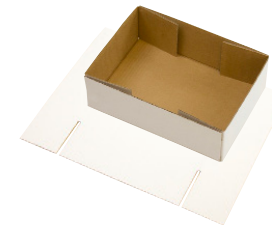
FEFCO 0452 - Ulimet bakke

For mere information kontakt os på telefon 45 - 700 702