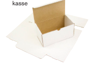
FEFCO 0470 - Selvlåsende kasse

For mere information kontakt os på telefon 45 - 700 702