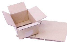
FEFCO 0201 - Foldekasse