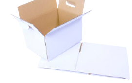
FEFCO 0711 - Kasse med håndtag og automatbund