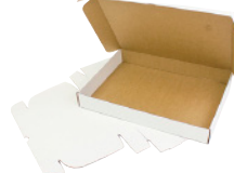
FEFCO 0427 - Posttæske