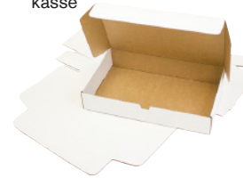
FEFCO 0429 - Selvlåsende kasse

For mere information kontakt os på telefon 45 - 700 702