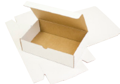
FEFCO 0421 - Selvlåsende kasse med låg