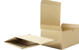
FEFCO 0713 - Automatbunds kasse med låg